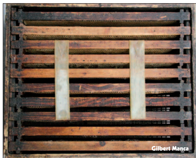
Mauvais positionnement des lanières.